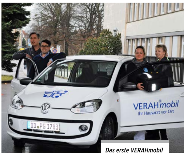
Das erste VERAHmobil ist ab sofort im Dresdener Raum im Einsatz.