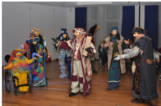
Darbietung Förderkreis Centro Arte Monte Onore e.V. (CAMO)